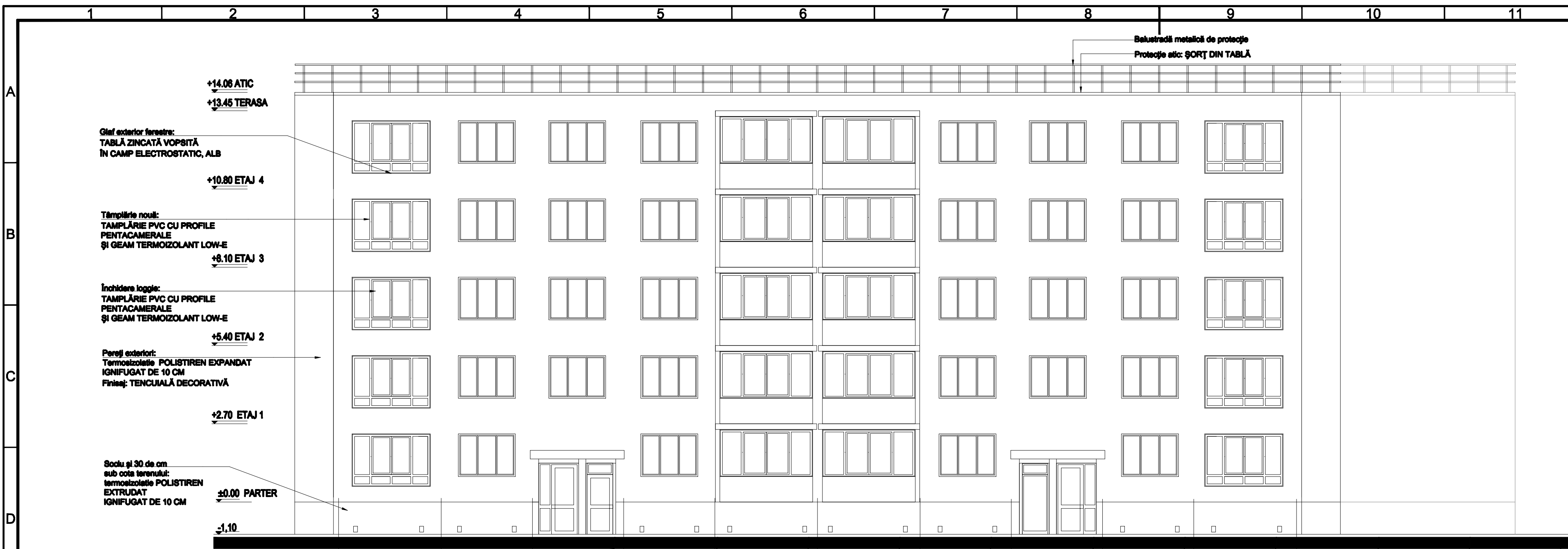
FATADA PRINCIPALA SC. 1, 2 (SC. 5, 6)